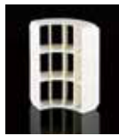
アイスセパレータ ×4個